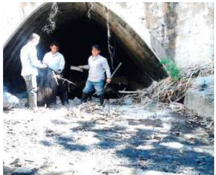
Canalización tratamiento fumigación y impieza en quebradas