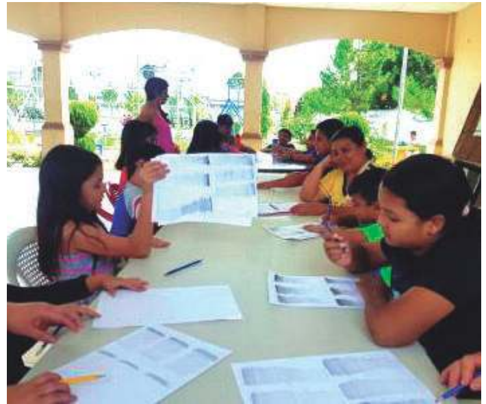
Programas para los jóvenes