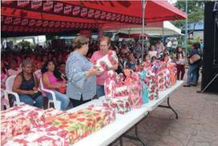
Celebración Día de las Madres, en el Parque Central