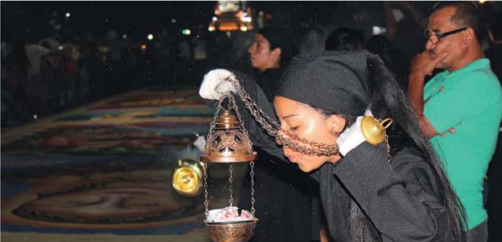
Actividades religiosas de Semana Santa en Antigua Cuscatlán