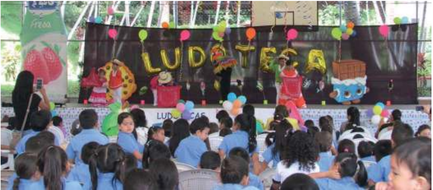
15to. Aniversario Ludoteca Municipal

Población atendida de niños de 2 hasta 12 años: 10,347 menores.