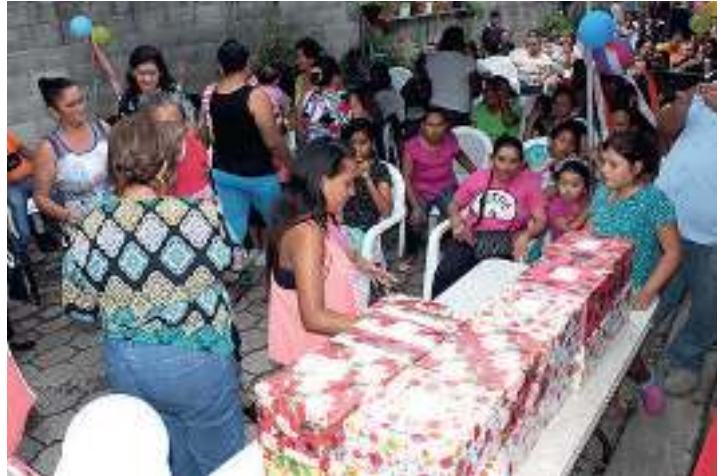
Celebración Día de las Madres, en las diferentes comunididades del municipio