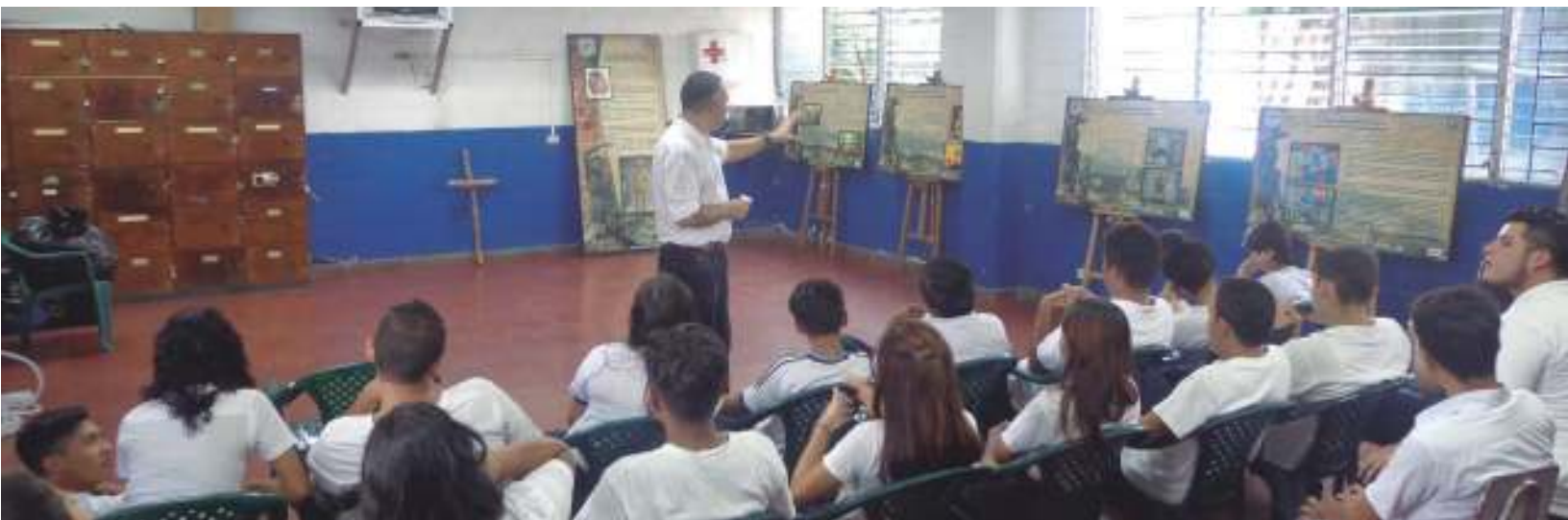
Exposición: "Sincretismo Religioso" realizada con los estudiantes de tercer ciclo vespertino del Centro Escolar Walter Thilo Deininger .