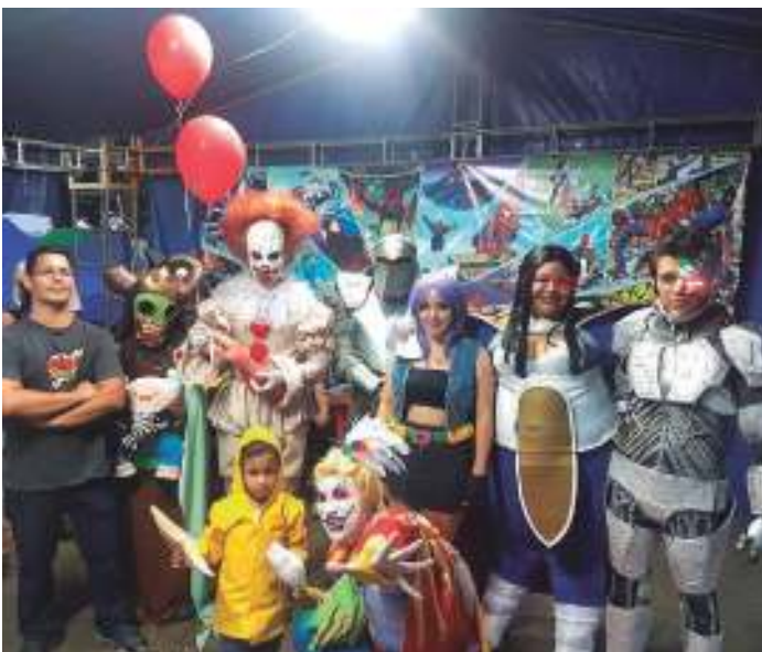
Festivales de exposición de talentos