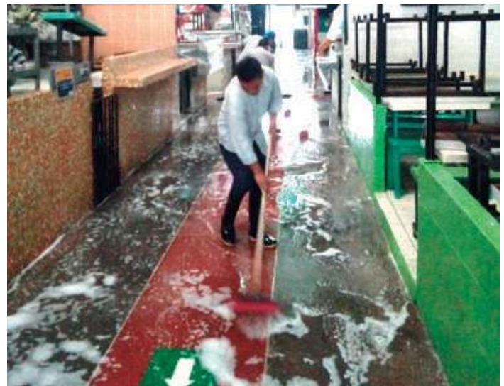
Lavado de Mercado y tratamiento de plancha