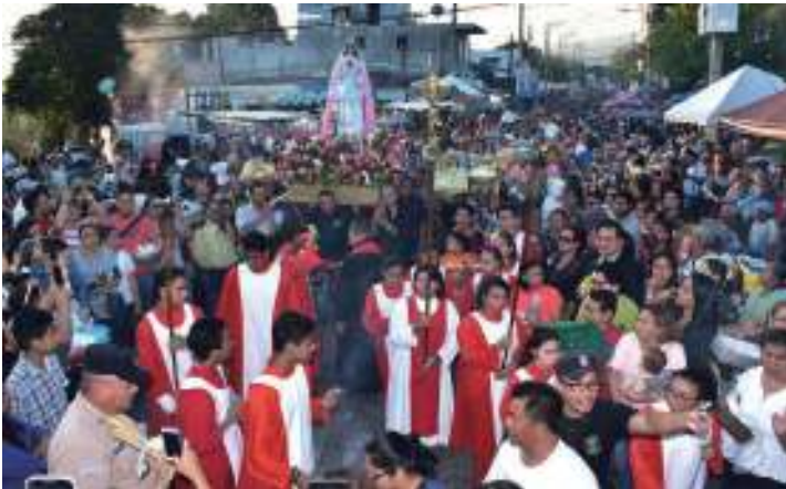
Fiestas Patronales 2018