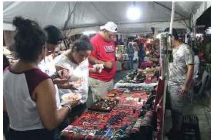
Gastronomía, artesanías, comidas típicas y más