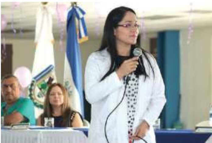
Foro Día Internacional de la Mujer