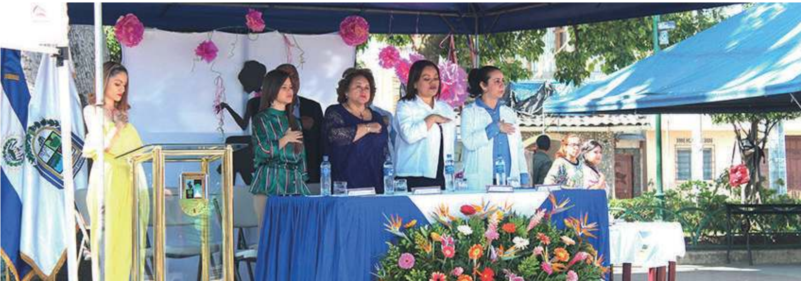
Celebración Día Internacional de la Mujer