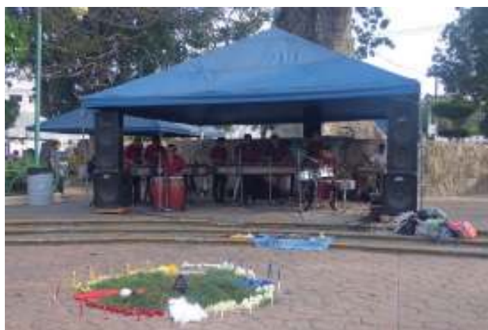
En conmemoración del Día Mundial de la Tierra , se realizó el Festival por la Tierra en el que se concientizó sobre el uso debido de los recursos naturales.