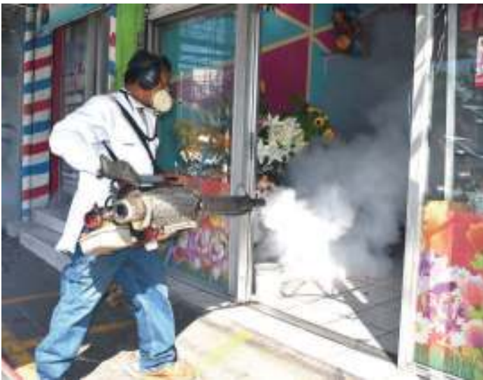
Fumigaciones en las diferentes colonias y comunidades

Población visitada: 40,030 - Población beneficiada: 70,110