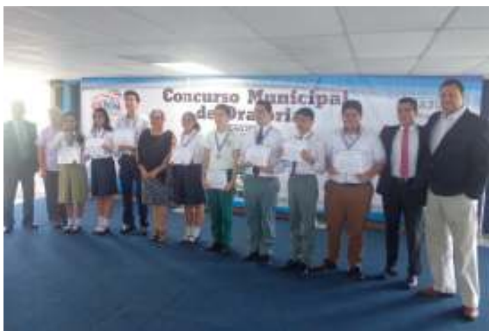
1º CERTAMEN MUNICIPAL DE ORATORIA. Este es el Primer Certamen Municipal de Oratoria denominado: "Jóvenes: nuestros valores" , en el que participaron alumnos del C.E. Walter Thilo Deininger, Colegio Esparza, Colegio San Francisco, Instituto Emiliani e I.N.A.C.