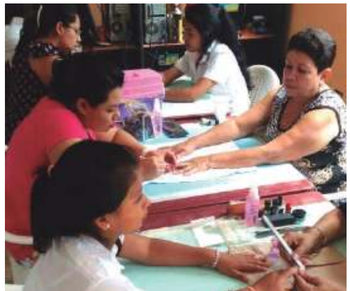
Cursos de uñas acrílicas