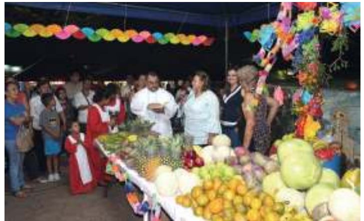
Celebración Día de la Cruz