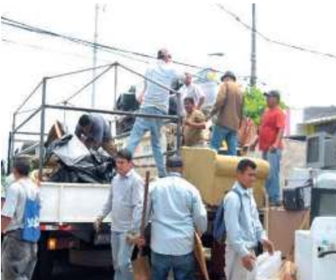
Campaña de limpieza y deschatarrización