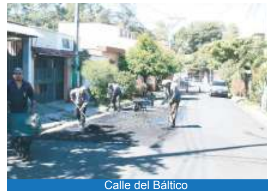
Calle del Báltico