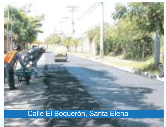
Calle El Boquerón, Santa Elena