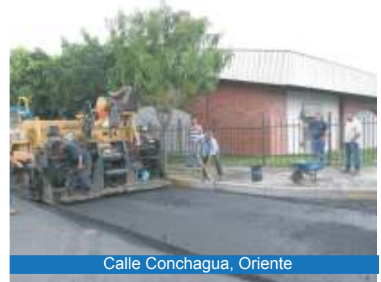
Calle Conchagua, Oriente

Reparación de calles y avenidas de Antigua Cuscatlán