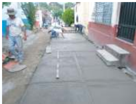
Mantenimiento de acceso peatonal del pasaje 9 sur