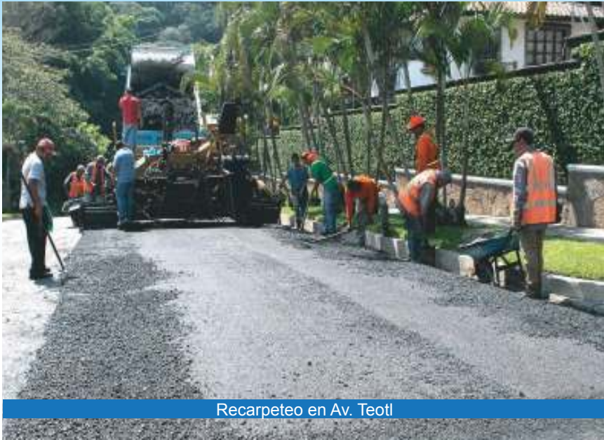
Recarpeteo en Av. Teotl