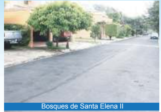
Bosques de Santa Elena II