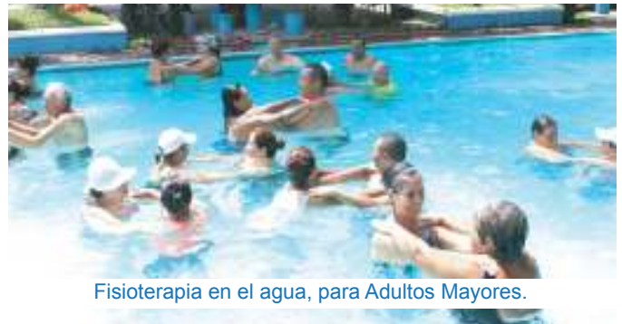
Fisioterapia en el agua, para Adultos Mayores.