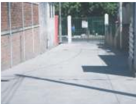
Mantenimiento de acceso peatonal del pasaje 9 sur