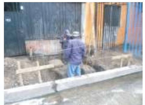
Construcción de Caseta de Vigilancia y Portón